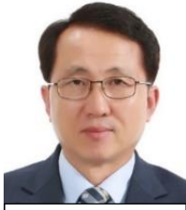
高 承天 仙台 韓国教育院長

안녕하세요! ご挨拶申し上げます。2020.2.21.より第16代 仙台韓国教育院長に就くことになった「코스친」です。こころより皆さんとの出会いを心待ちにしております。