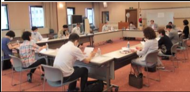
マスク・消毒・距離などを確保した会議となった

6/11(木)15時から行われた第1回三機関長役員及び執行委員合同会議はコロナウイルスの影響により今年度初めての開催となった。15名が出席、金団長は冒頭の挨拶で「新型コロナウイルスはまだまだ油断できないですが民団中央本部より6月から民団活動を再開するよう通達があり今後の予定などを忌憚のない意見を頂き運営に生かしたいと思っております」と挨拶。2時間に及び意見交換が行われた。次回は7/14(火)15時~