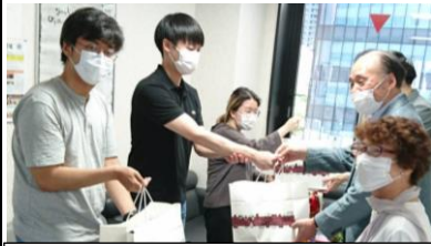
金団長より支援品を手渡しました