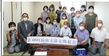
久しぶりの再会に集まった団員の皆様