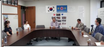
三機関長・婦人会長・教育院長意見交換会

5月29日(金)午後4時から三機関長・婦人会長・教育院長との意見交換会が行われた。高教育院長は赴任100日にちなんで無事にここまでこれたことについてお礼を申し上げた。会議は6月から行事などを徐々に行う予定で状況を見極めながら協力し合うことを話し合った。