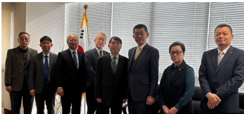
駐仙台韓国総領事館訪問