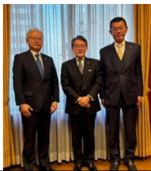
宮城県日韓親善協会会長訪問