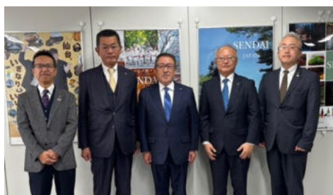
仙台市議会議員訪問