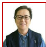
徐龍子婦人会会長

会員の皆様、団員の皆様、明けましておめでとうございます。 今年も婦人会員の皆様と楽しい時間を過ごせるよう、3 月上旬に親睦旅行計画中です。 2026 年もどうぞ宜しくお願い致します。