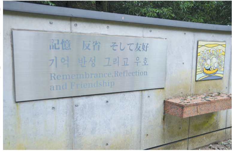
「群馬の森」に建つ「記憶、反省、そして友好」

例えは出たにせよ、韓国人100人と600人余りの中国人捕虜が働かされたことが地下導水路工事請け負った間組の『歴史』に記録されている。「群馬の森」にもかつて旧軍の火薬庫があった。