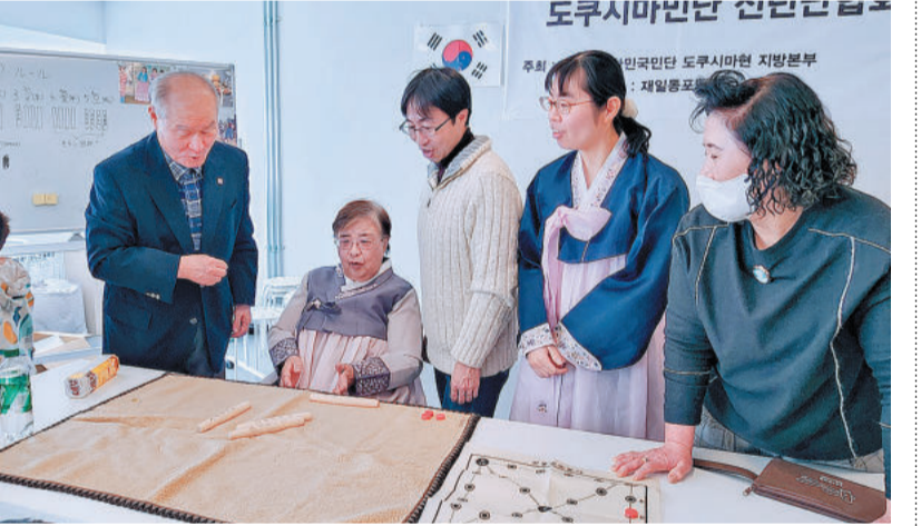
全員、ユニノリ大会で韓国の文化にふれる（徳島）

「新成人は、韓国文化の紹介も行った。同本部と共催した駐日韓国大使館代表として尹徳敏大使が「失敗してもいい、挫折してもいい。迷わず取り戻せ、そしてその20代に与えられた特権を積極的にチャレンジしていろんな経験を積んでいってほしい」と激励を述べた。