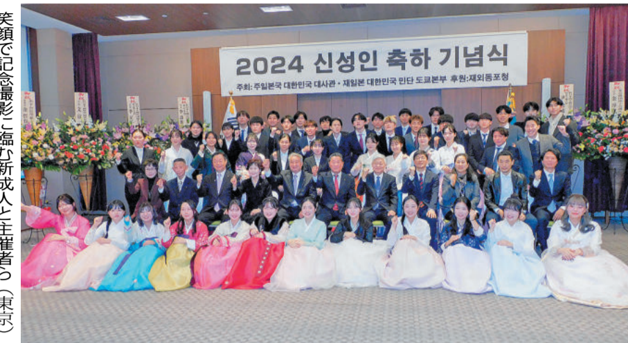
東京と大阪をはじめとする大手の各民団地方本部が20歳の若さを迎えた同郷新成人の集いを祝った。各来賓からは失敗や挫折を恐れず、めざす自問に向かって積極的にチャレンジを呼びかけた。新成人からは韓日両国の懸け橋となるような夢と希望をもつてまっしぐらに決意表明があった。