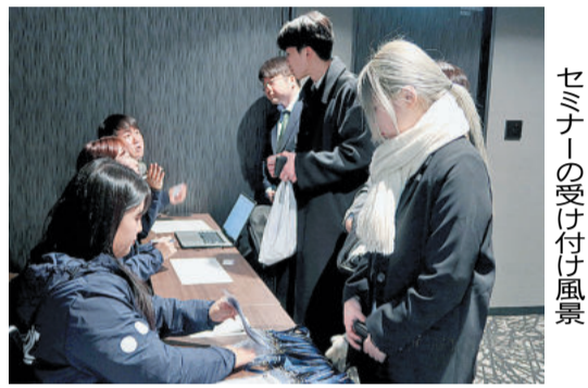
セミナーの受け付け風景