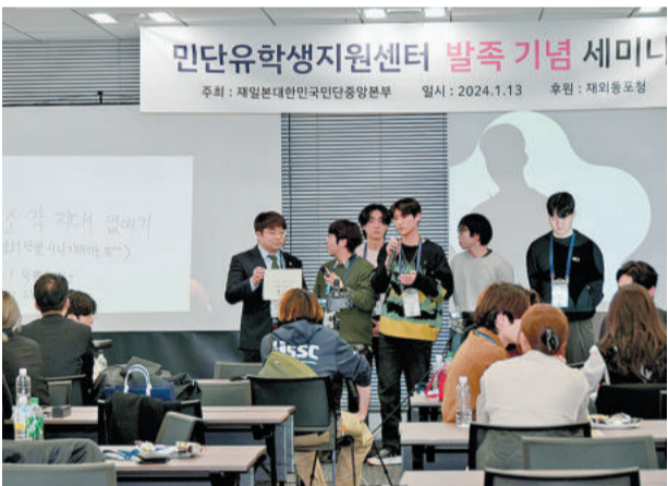
留学生生活の死角をなくそう。孤立化・孤独化防止対策を発表する学生ら

支援センターのいろんな交流活動を通じて仲間や情報交換もたくさんしたいと笑顔で述べた。「より楽しい留学生生活を送るためのネットワーク強化」「留学生支援センター活用案」について学生たちは、奨学金制度や日常生活、日本の就職活動などのサポートに期待を寄せた。