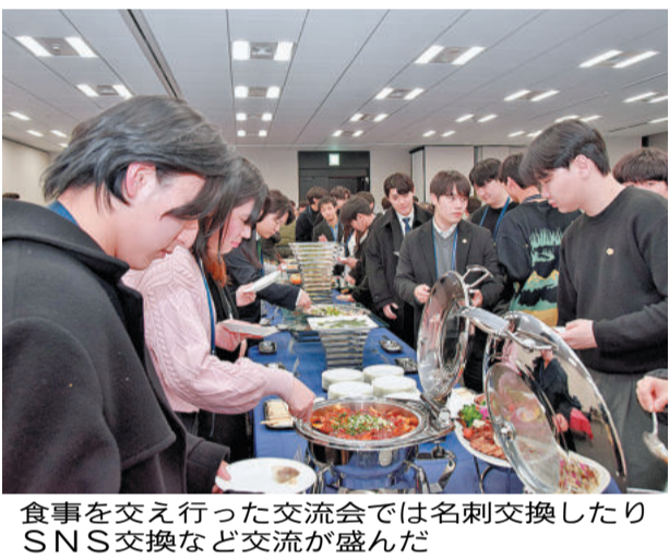
食事を交え行った交流会では名刺交換したりSNS交換など交流が盛んだ