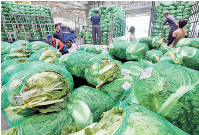
市場に次々入荷される白菜

白菜は低カロリーで、ビタミンCが豊富で、抗がん効果の研究も進んでいる。白菜は、韓半島の食文化に欠かせない野菜である。白菜は、韓半島の食文化に欠かせない野菜である。