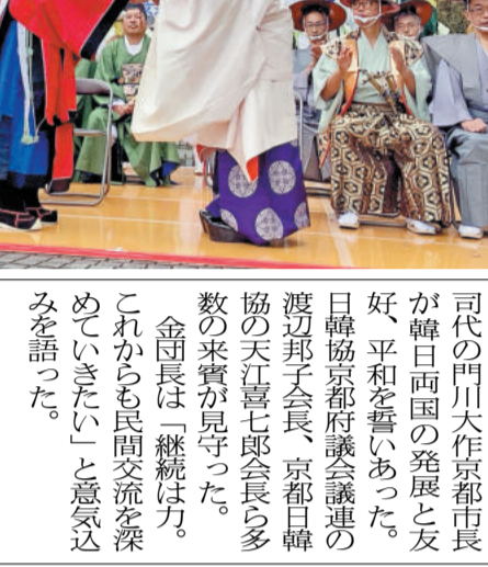
講演する保阪正康さん(箱根)

【東京】民間愛知本部は、10月20日、東京で「保阪正康氏講師に」組織幹部研修会を開催した。保阪氏は、歴史をテーマに講演を行った。 【東京】民間愛知本部は、10月20日、東京で「保阪正康氏講師に」組織幹部研修会を開催した。保阪氏は、歴史をテーマに講演を行った。