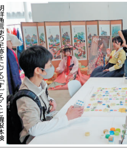
朝鮮通信使の足跡をたどる「正使」の再現

【名古屋】第69回名古屋まつり(名古屋まつり)の一環として、10月21、22の両日、市内各所で「朝鮮通信使」行列の再現が行われた。約50名の参加者が、名古屋市中区役所から矢場町までを練り歩いた。 【愛知】第69回名古屋まつり(名古屋まつり)の一環として、10月21、22の両日、市内各所で「朝鮮通信使」行列の再現が行われた。約50名の参加者が、名古屋市中区役所から矢場町までを練り歩いた。