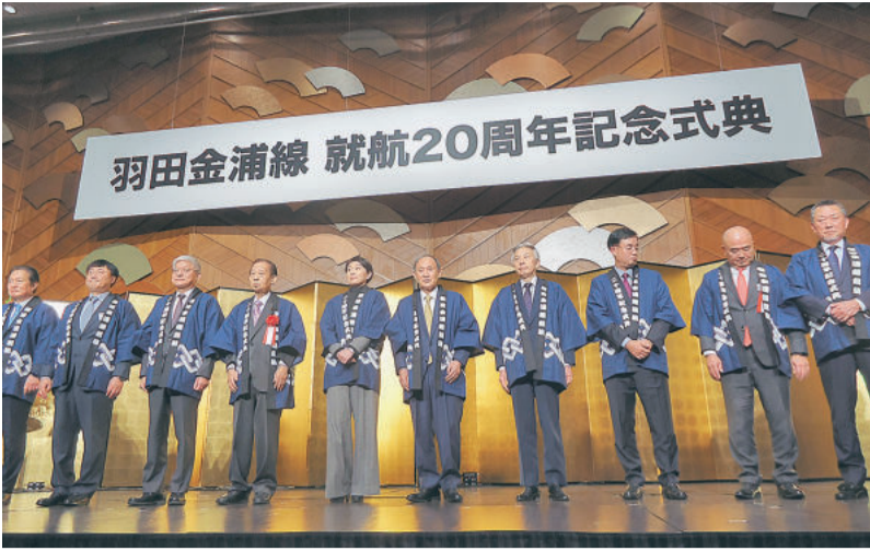
羽田金浦線 就航20周年記念式典。左から、国土交通省の佐藤俊輔副大臣、韓国の鄭成源駐日大使、羽田金浦線の代表者ら。

東京国際空港ターミナルの4社が主催した。 羽田・金浦線は20周年を迎えた。空問題が韓日関係の発展のために重要な役割を果たしている。韓日関係が改善され、韓日間の航空輸送力の増強が期待されている。