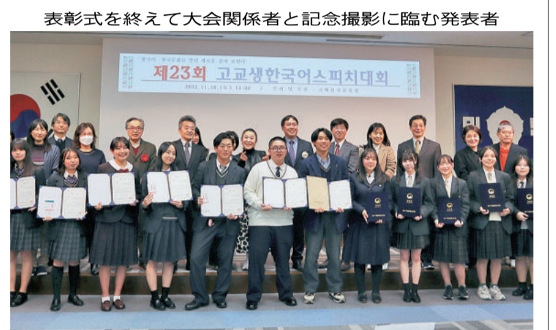
表彰式を終えて大会関係者と記念撮影に臨む発表者

【山口】下関市と姉妹都市関係にある釜山市の雰囲気を感じて、体感できる「釜山フェスタ」(下関市観光振興課主催)が11月23日、下関市竹崎2丁目、グリーンモール商店街で開かれた。