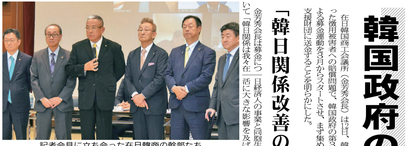
記者会見に立ち会った在日韓商の幹部たち