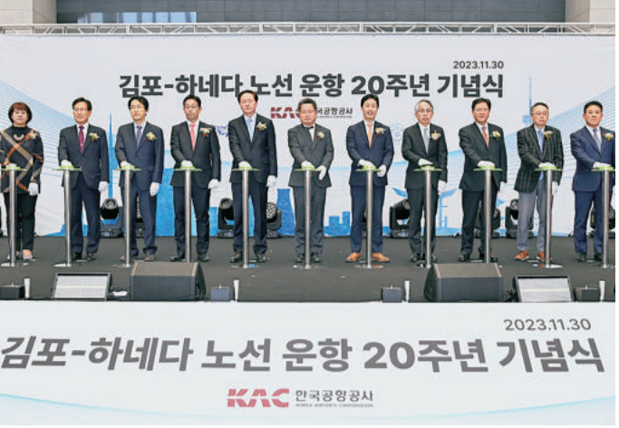
2023.11.30 김포-하네다 노선 운항 20주년 기념식. KAC 한국항공공사.