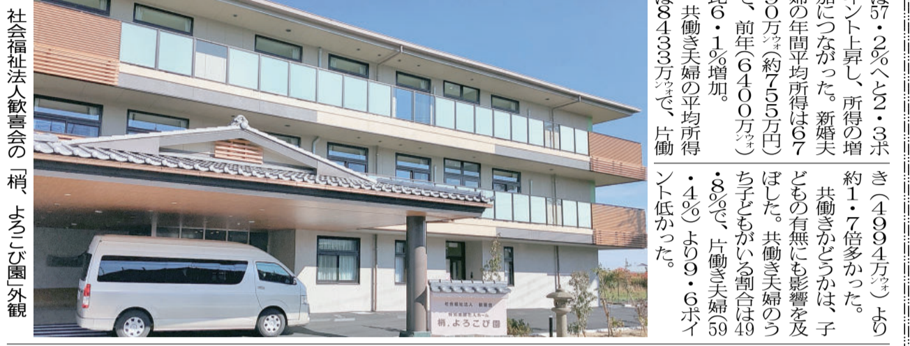
社会福祉法人歓喜会の新築、よここ園外観

【高松】民団高松本部が11月25日、高松市内の本部で開かれた。45歳までの男女53人が参加した。