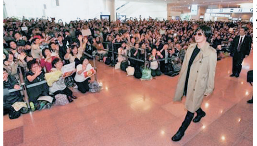
2007年に「冬のソナタ」のペ・ヨンジュンが来日した際には羽田空港に5000人のファンが集った。韓流20周年記念式典の様子の一部。

羽田金浦線は、2003年11月30日の就航以来、約3000万人の乗客を運んだ。冬ソナの影響で、韓日間の航空輸送力が強化されている。これは、韓日関係の改善に貢献している。