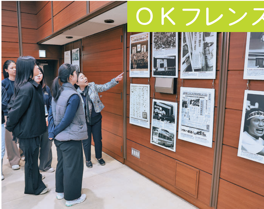
民団中央本部のパネル展示で在日の歴史を学ぶサポーターズ