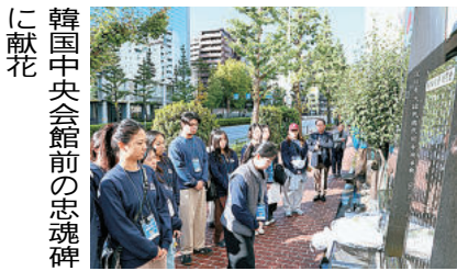
民団中央会館前の忠魂碑に参拝

は同8日に東京入りし、在日韓国人青年協会の進行要員として、参加者の引率、通訳・翻訳、ネットワーク構築などを担っている。東京では、本国出身をはじめ、韓国、ウズベキスタン、カザフスタン、ドミニカ、中国などから29人の同胞が参加。一行