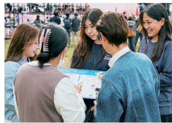
四天寺ワッソで市民と交流

は同8日に東京入りし、在日韓国人青年協会の進行要員として、参加者の引率、通訳・翻訳、ネットワーク構築などを担っている。東京では、本国出身をはじめ、韓国、ウズベキスタン、カザフスタン、ドミニカ、中国などから29人の同胞が参加。一行