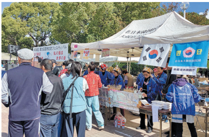
秋晴れの下、出店の韓国料理を味わう参加者