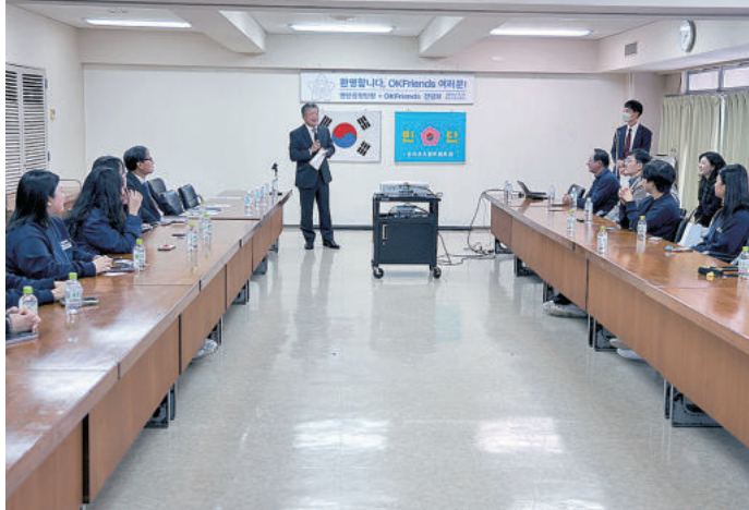
中央本部金利中団長との懇談会