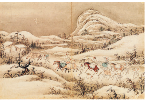
「雪向市圖」朝鮮時代の商団一行が馬と牛に物をいっぱい積んだまま市場に行く行列が描写されている。©国立中央博物館

清のドイツ領事館に勤めていたハル・ゲオル、番の心配事は食事だった。夕方に夕飯を、一人フーフン・メンドル。フーフン・メンドルは、朝鮮初