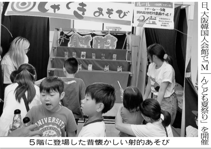
5階に登場した昔懐かしい射的あそび

民間大阪 会館まるごと遊び場に「子ども夏祭り」に千人。同本部としては初の企画。家族連れ1000人余りが夏休み最後の週末を満喫した。